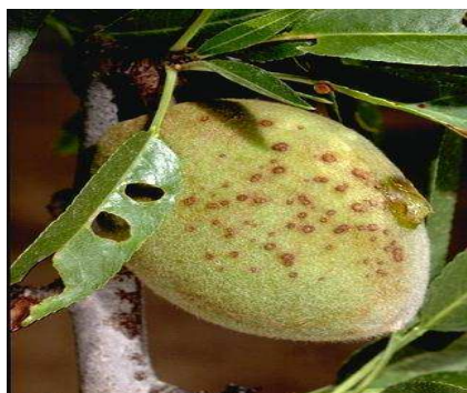
Εικόνα 3 Συμπτώματα κορύνεου σε φύλλα (τρύπες από σκάγια), βλαστό και καρπό