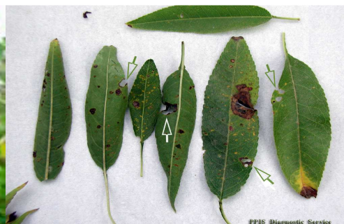
Εικόνα 7-προσβολή φύλλων από κερκόσπορα