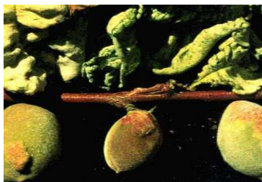
Εικόνα 2 Συμπτώματα εξώασκου σε φύλλα και καρπούς αμυγδαλιάς

Μυκητολογικές ασθένειες που προσβάλλουν τα φύλλα, τα άνθη και στη συνέχεια και τους καρπούς.