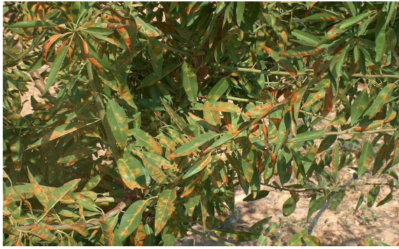
Εικόνα 4 - Πολυστίγμωση

ΣΥΝΘΗΚΕΣ ΑΝΑΠΤΥΞΗΣ-ΣΥΜΠΥΩΜΑΤΑ: Υγρός και βροχερός καιρός είναι απαραίτητος για την πραγματοποίηση των μολύνσεων. Τα φύλλα είναι ευπαθή στις μολύνσεις καθόλη την βλαστική περίοδο.