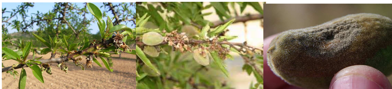
Εικόνα 1 Συμπτώματα μονιλίας σε βλαστούς και καρπό αμυγδαλιάς

Ο μύκητας διαχειμάζει στα έλκη, στους μουμιοποιημένους καρπούς και στους αποξηραμένους κλάδους. Η είσοδος του παθογόνου στο δένδρο γίνεται από οποιοδήποτε μέρος του άνθους και από τους καρπούς