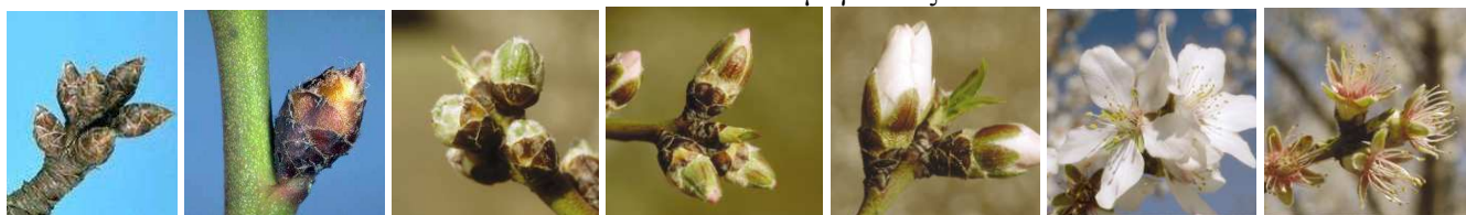
A Διάπαυση B Διόγκωση οφθαλμών C Πράσινη Κορυφή D Ροζ Κορυφή E Λευκή κορυφή F Πλήρης άνθηση G Πτώση πετάλων

Από παρατηρήσεις διαπιστώθηκε ότι οι πρώιμες ποικιλίες στις πρώιμες περιοχές βρίσκονται πλήρη άνθηση οι όψιμες στο στάδιο της πράσινης ή ροζ και λευκής κορυφής.