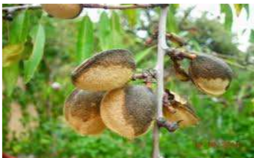
Εικόνα 6-Προσβολή από Ανθράκωση