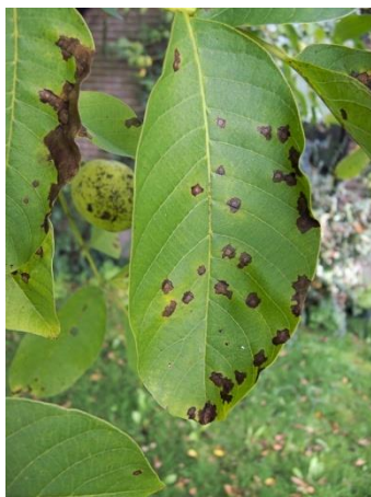
Εικ. 10. Προσβολή φύλλου