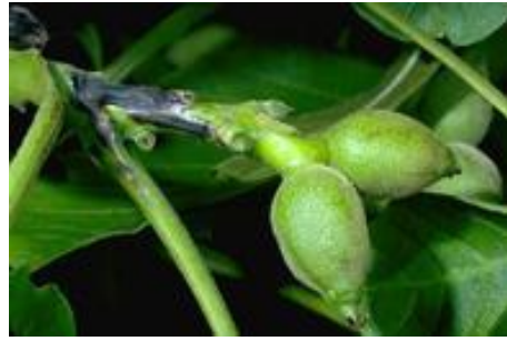
Εικ. 7. Προσβολή τρυφερού βλαστού