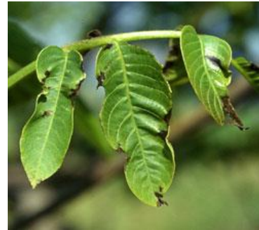
Εικ. 8 & 9. Προσβολή φύλλων