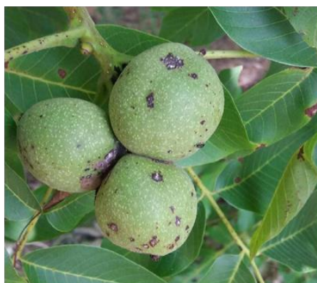
Εικ. 11. Προσβολή καρπού