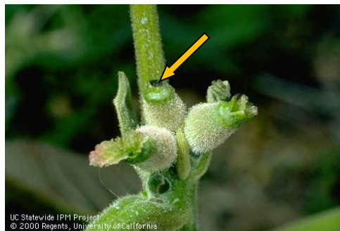
Εικ. 3. Προσβολή θηλυκού άνθους