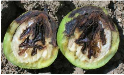
Εικ. 6. Μαύρισμα ψίχας