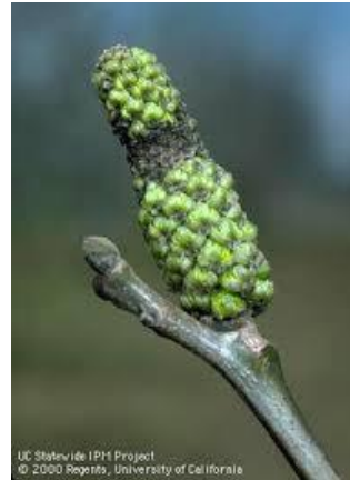
Εικ. 1 & 2. Προσβολή ιούλων