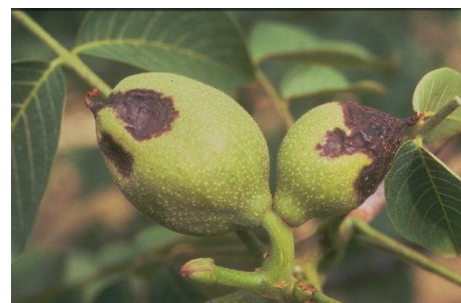
Εικ. 4 & 5. Προσβολή καρπών